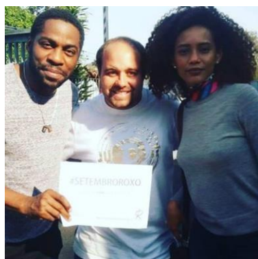
Thaís Araújo e Lazaro Ramos