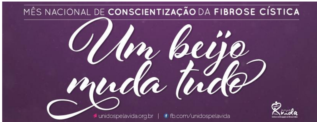
Capa para Facebook