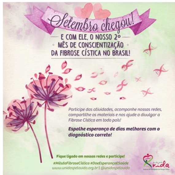
Teaser – Setembro chegou, e convite para acompanhar todas as atividades do Mês