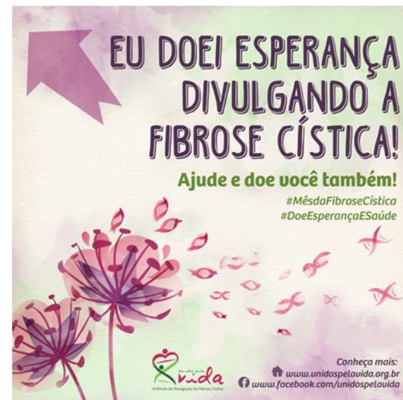
Teaser para compartilhamento virtual