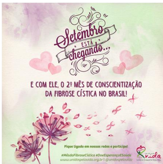
Teaser “Save the Date” – Setembro está chegando