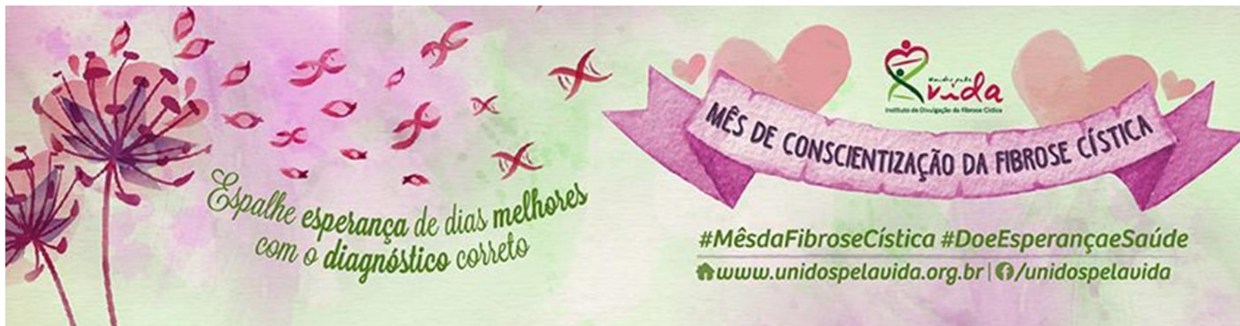
Capa personalizada para o facebook